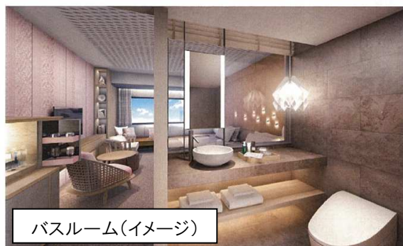
バスルーム(イメージ)