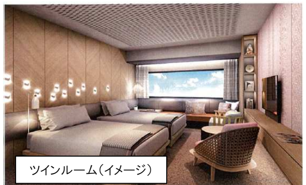
ツインルーム(イメージ)