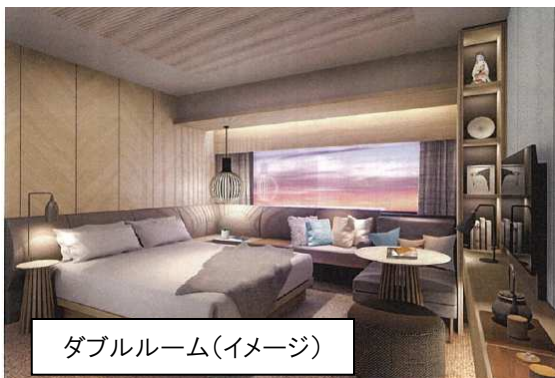
ダブルルーム(イメージ)