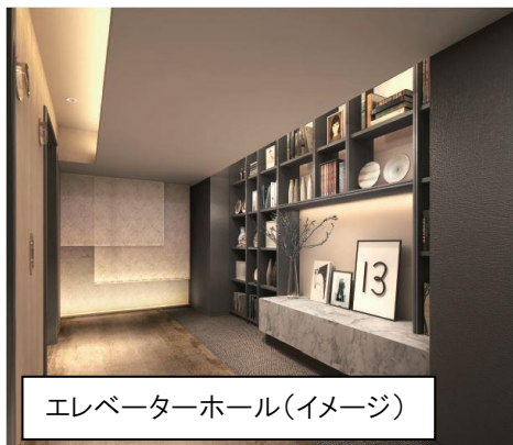
エレベーターホール(イメージ)