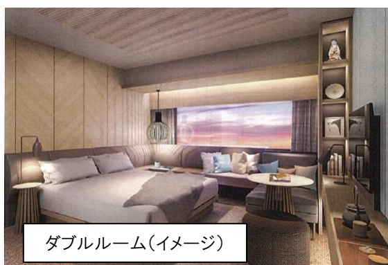
ダブルルーム(イメージ)