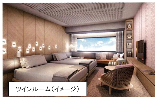
ツインルーム(イメージ)