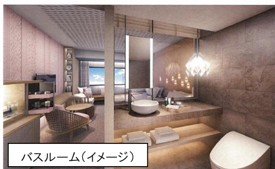
バスルーム(イメージ)